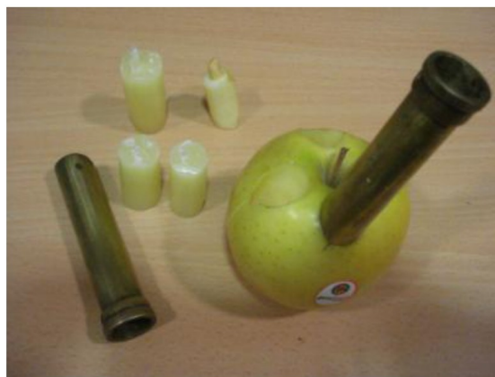
Figura 4. Una buena manera para obtener cilindros de manzana. Hay que limpiar muy bien el material de corte.

La vela comestible lleva la almendra, un fruto seco con un alto contenido en aceites, que son el combustible que arde (figura 6). El presentador del experimento, tendrá la precaución de asegurarse que lo que se lleva a la boca está a una temperatura apta para comerse.