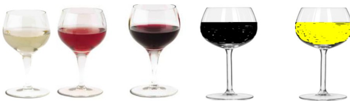
Figura 2. Los diferentes colores obtenidos.

Es la historia de un servicial camarero que ante las dudas de un cliente es capaz de servirle en cada momento una copa de la bebida pedida. El cliente que pide sucesivamente, un vaso de vino blanco, luego quiere cambiarlo por vino rosado, después por un tinto, a continuación por un café y el último por un té frío (Cahay et al. 2006).