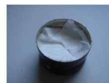
un papel de filtro para sujetarlo