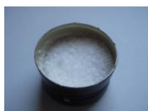
con tiosulfato de sodio