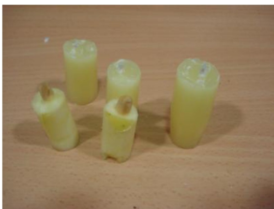
Figura 5. Cinco “velas”.