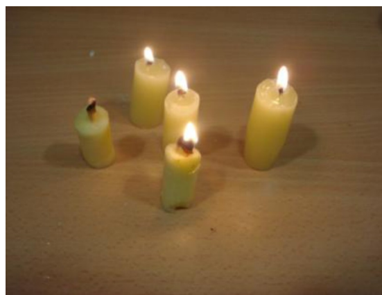
Figura 6. ¿Cuáles son las velas comestibles?